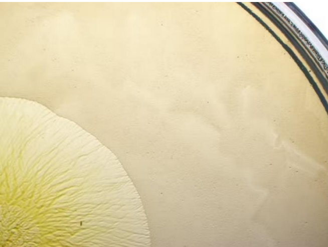
M. xanthus (en jaune à gauche) envahissant une population de proies (en beige) dans une boîte de Petri.

Des scientifiques de l'Ecole Polytechnique de Zurich ont découvert, par hasard, qu'en modifiant un paramètre de température dans les conditions de croissance des bactéries Myxococcus xanthus (prédatrice) Pseudomonas fluorescens (proie) leur rôle s'inversait. Plus d'info